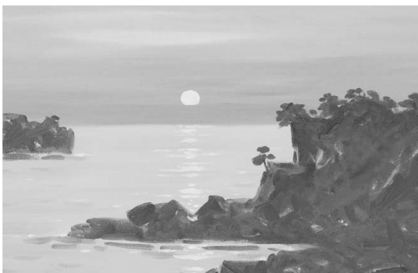
·작품명 : 동해일출 ·재료: Oil on Canvas 규격 : 10호