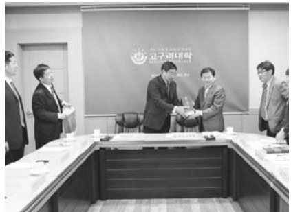
고구려대학교와 중국 치치하얼대학은 2012년 8월 10일 대학 상호간의 활발한