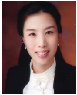
나 헤울 초등학교 교사, 유아교육과(95학번) 졸업

세상엔 완벽한 준비란 없습니다. 삶은 여차피 모험이고 그 모험을 통해 내 영혼이 성숙해지는 학교입니다. 물론 심사숙고해서 결정해야 하겠지만 백 퍼센트 확신이 설 때까지 기다려다 길을 나서겠다고 하면 너무 늦어요. 설사 실패를 한다 해도 실패만큼 좋은 삶의 선생님은 없습니다.