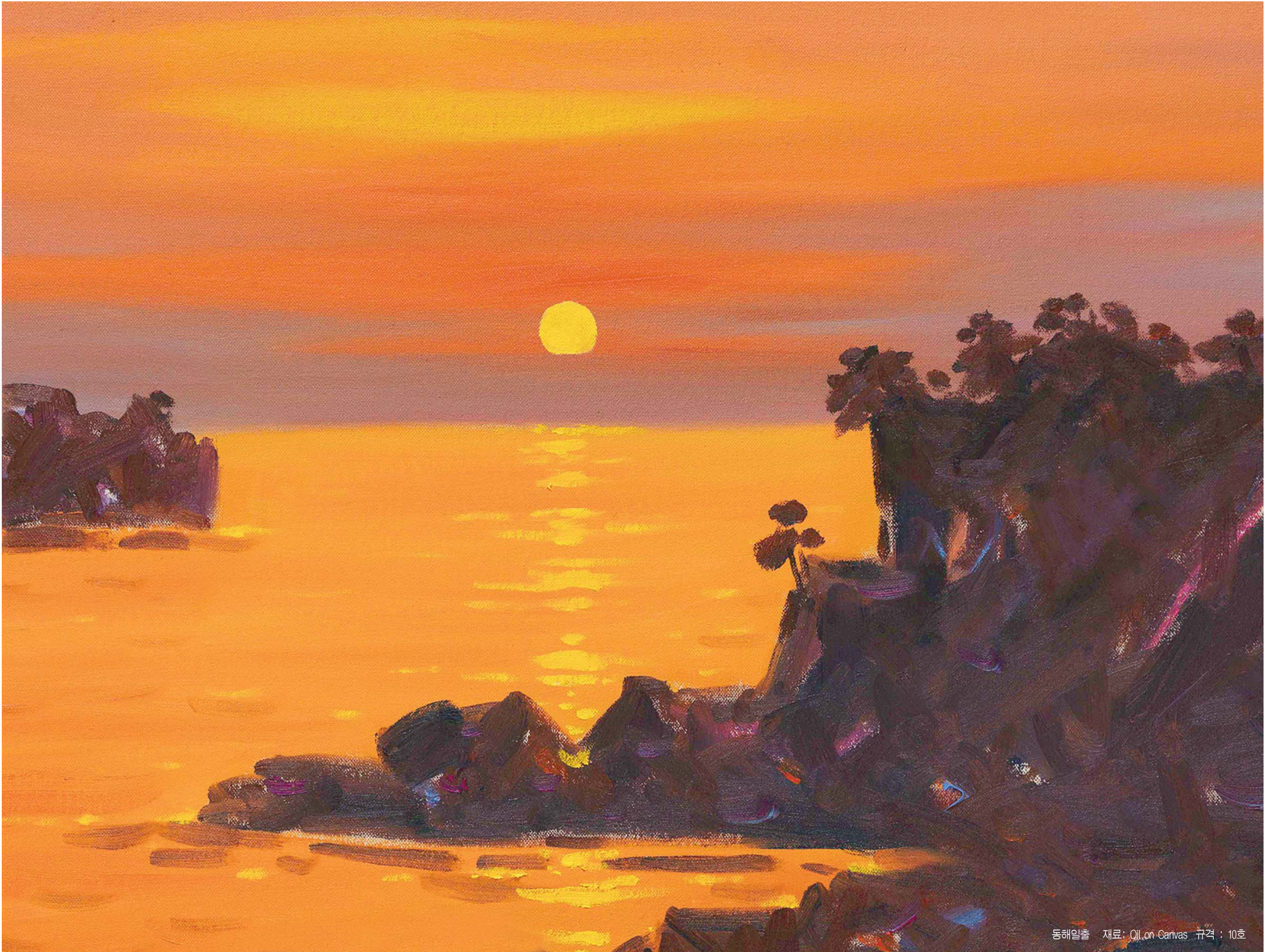
동해일출 재료: Oil, on Canvas 규격: 10호